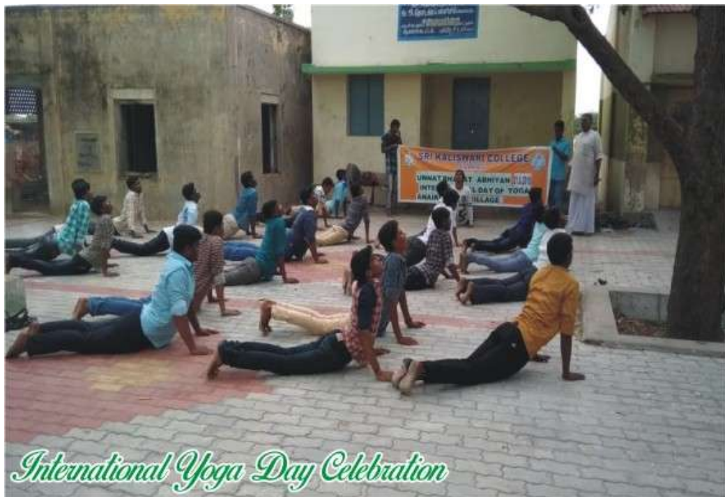
International Yoga Day Celebration