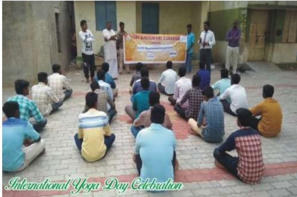
International Yoga Day Celebration